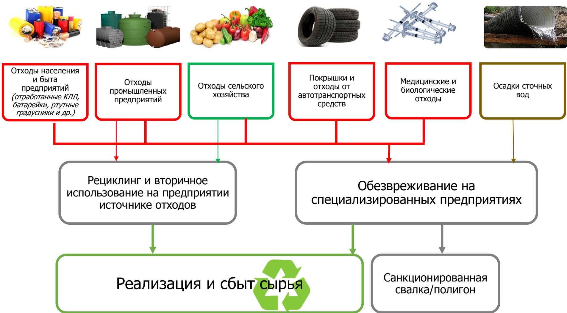
Рисунок 4.1 – Предлагаемая схема обращения с опасными отходами на территории ГП Ревда